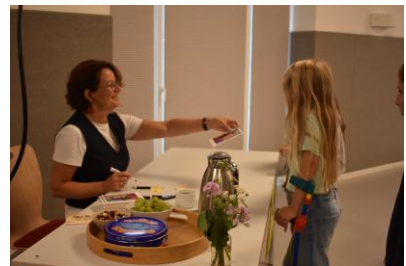
Ausschnitt aus dem Pressebericht: